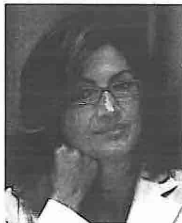
Mariastella Gelmini, ministro della Pubblica Istruzione