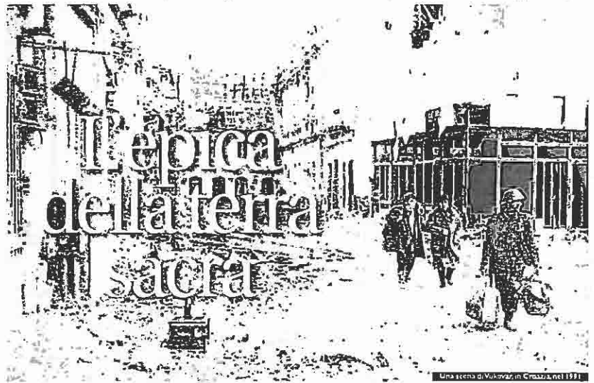
Una scena di Vukovar, in Croazia, nel 1991

LIBRI. Il nuovo romanzo di Michael D. O'Brien, autore del bestseller «Il Nemico», sulle sofferenze della Croazia, da Tito ai nostri giorni